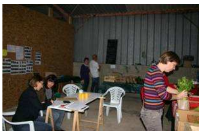
Photos distribution AMAP Les paniers d'Eole-2010