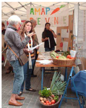
AMAP du potager, Village MESS 25/09/2010