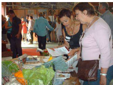
L'AMAP du Vert Solidaire de Soissons - Foire de la Capelle 2010