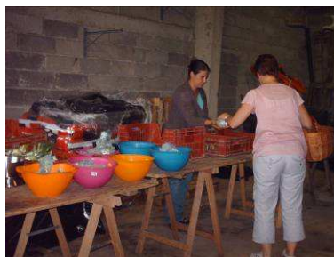
Distribution AMAP Ste Geneviève-(60) 2010