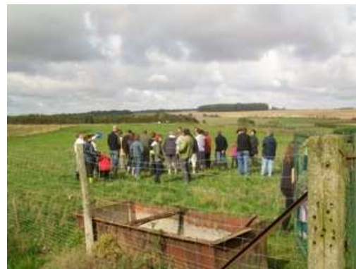
Visite de ferme -AMAP Les paniers d'Eole- 2010

Une AMAP dynamique et une bonne communication, voilà une des clés d'un partenariat qui marche ! Bon vent à l'AMAP les Paniers d'Eole !