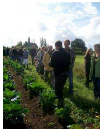
Visite de ferme -AMAP Les paniers d'Eole- 2010